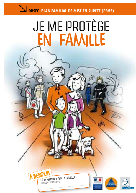
Couverture du guide